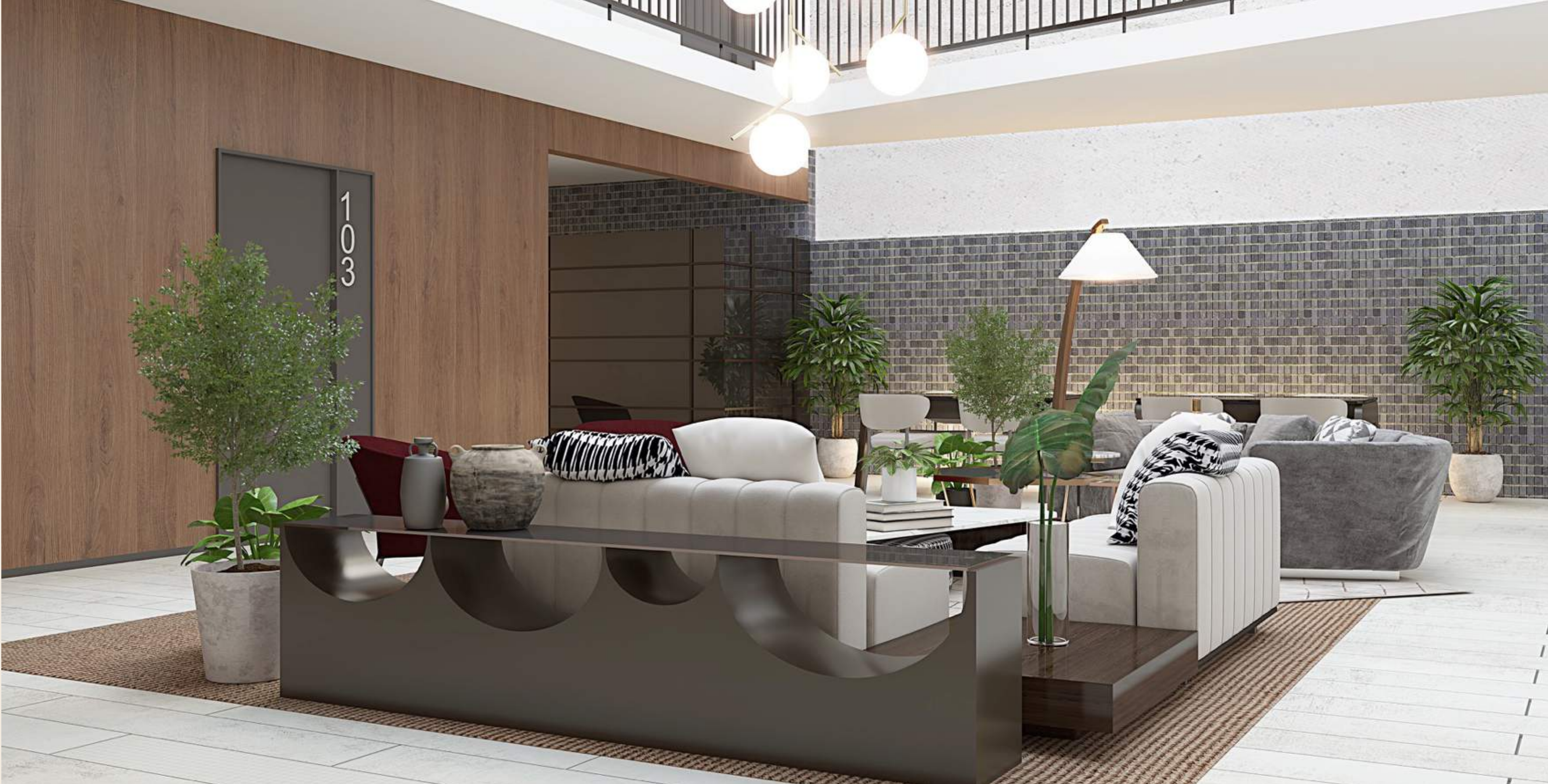
Lobby + Zona de co-working