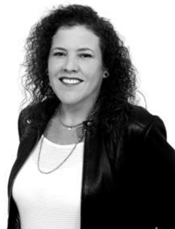
Iluminación: Arq. Claudia Paz

“El proyecto busca construir una experiencia urbana íntima y exclusiva con una estética definida por una arquitectura que imagina un oasis como un escape a una ciudad donde se vive cada vez más rápido.