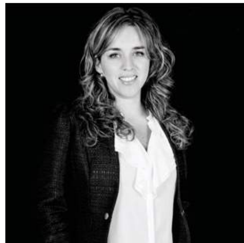
Decoración: Arq. Vera Velarde