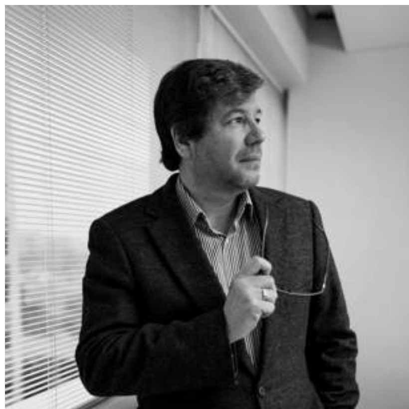
Arquitectura: Arq. Jose Órrego